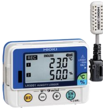
LR5001 (外付けセンサは LR9504)