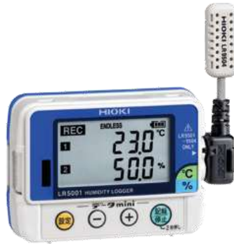
LR5001 (外付けセンサは LR9504)