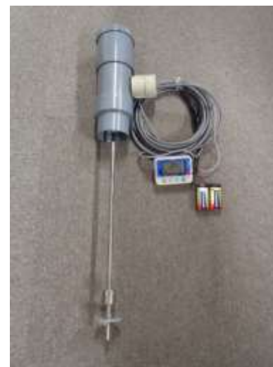
GY 式精密水位計 UIZ-GY030-LR

データロガーには、プレヒート機能を備えているので、省電力での計測ができます。操作も簡単で、特に、データコレクタ*を使用した場合、データ回収時に現地へパソコンを持参せずにデータの回収ができるなど、環境計測の様々な条件に適応します。