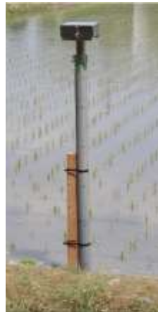
水田用水位計設置例