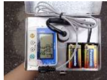
ロガー格納箱内部